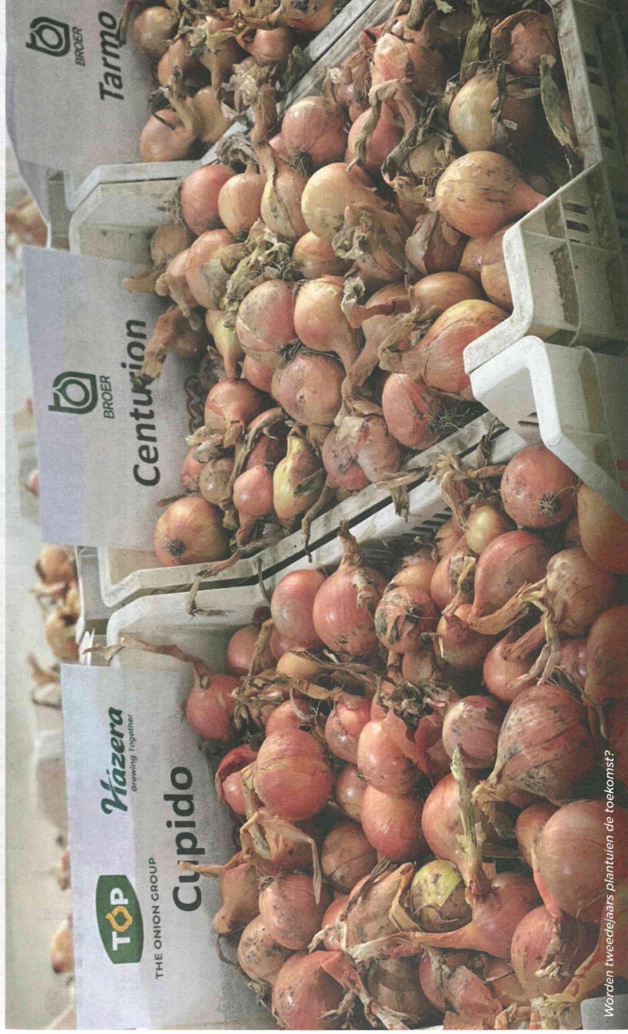
Worden tweedejaars plantuien de toekomst?

op dit moment nog een kleine markt, maar het kiezen voor deze niches kan ook de kracht van je bedrijf zijn. Het zijn uiensoorten met duidelijke kansen, maar ook de nodige uitdagingen. Kijk daarom goed naar de markt die je wilt betreden en het doel van je teelt. Hier sluit je vervolgens de juiste teelt op aan, is de boodschap van deze Uien dag. De uienteelt is in de loop der jaren uitgegroeid tot topsport, maar een beetje beweging is voor ieder mens gezond, toch? •